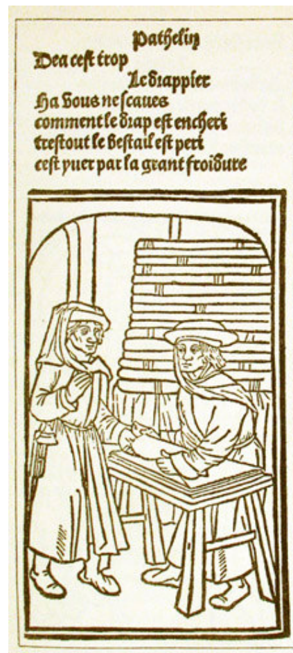
Farce de maître Pierre Pathelin (anonyme, entre 1464 et 1469)

Le décor et les accessoires de la farce sont « simplistes ». Le style est dépouillé. Les effets visuels utilisés sont un jeu d'acteur masqué . On peut également noter la présence d'effets verbaux : surabondance et fantaisie verbale (calembours) et prosodiques (jeux de timbres ou d'accents).